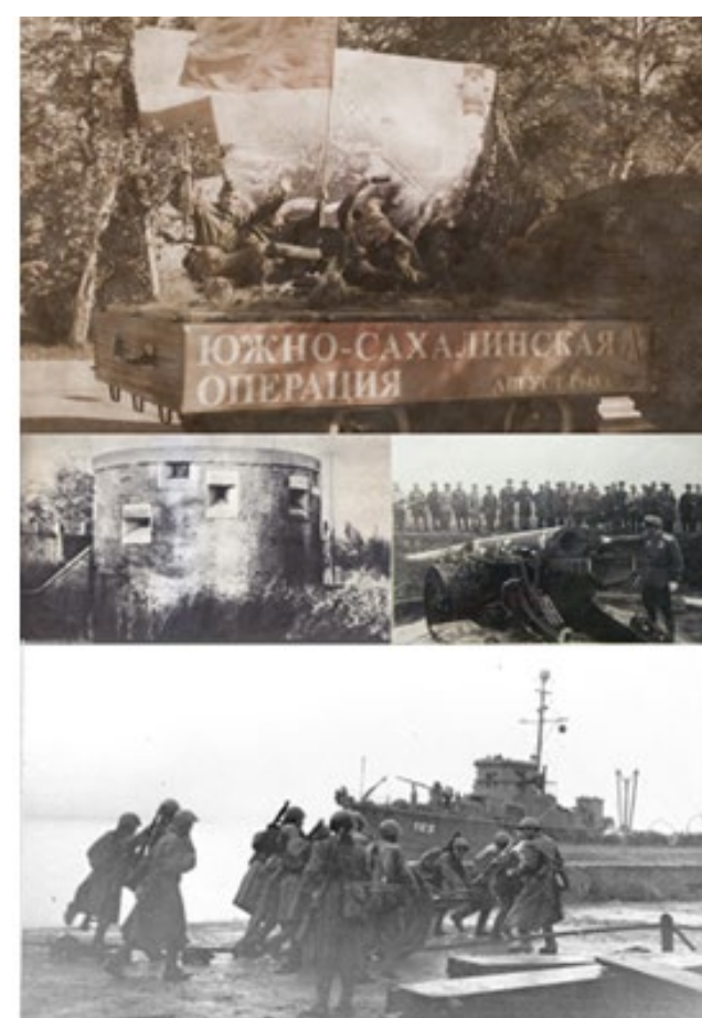
Хроника истинного героизма

Герой Советского Союза (посмертно). Участник Курильской десантной операции Родился 28 января 1927 г. в селе Пугачёвка Новоомского района Омской области.